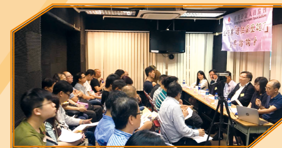
2018 年舉辦公證業「過往資歷認可」業界諮詢會

為了方便同業申請物流業(支援及輔助服務—公證服務)「過往資歷認可」資歷，協會將安排特定晚上時間接收申請表，同時也會按申請人數往各同業機構協助填寫申請表，有意者可致電 2771 2568 與協會職員聯絡。